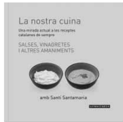
Dijous, 9: SALSSES, VINAGRETES I ALTRES AMANIMENTS

Cada DIJOUS i DIVENDRES, amb La Vanguardia, PER NOMÉS 1,5 €