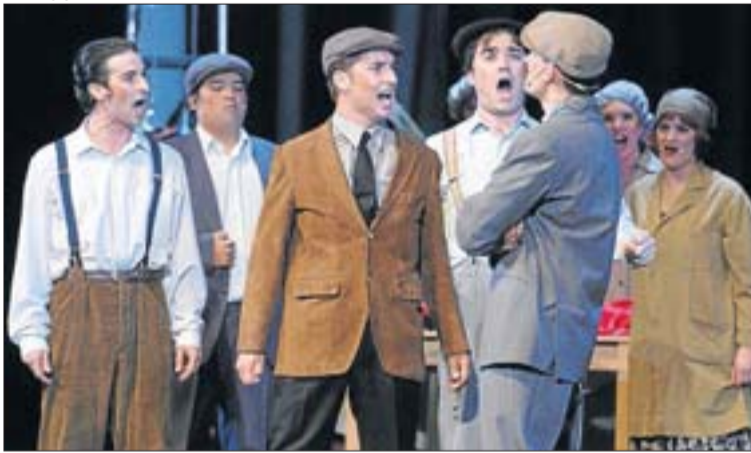
La lluita de classes és un dels eixos argumentals del musical